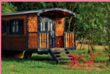
Roulottes de campagne