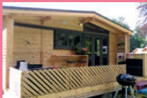
Cabanes d'Hansel et Gretel

Village toue des Demoiselles Séjours insolites en Auvergne